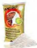
Bianco ART 470616