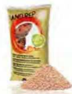
Rosso ART 470654