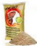
Giallo ART 470630