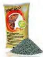
Verde ART 470753