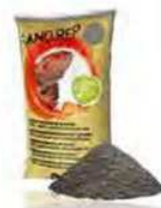
Nero ART 470777