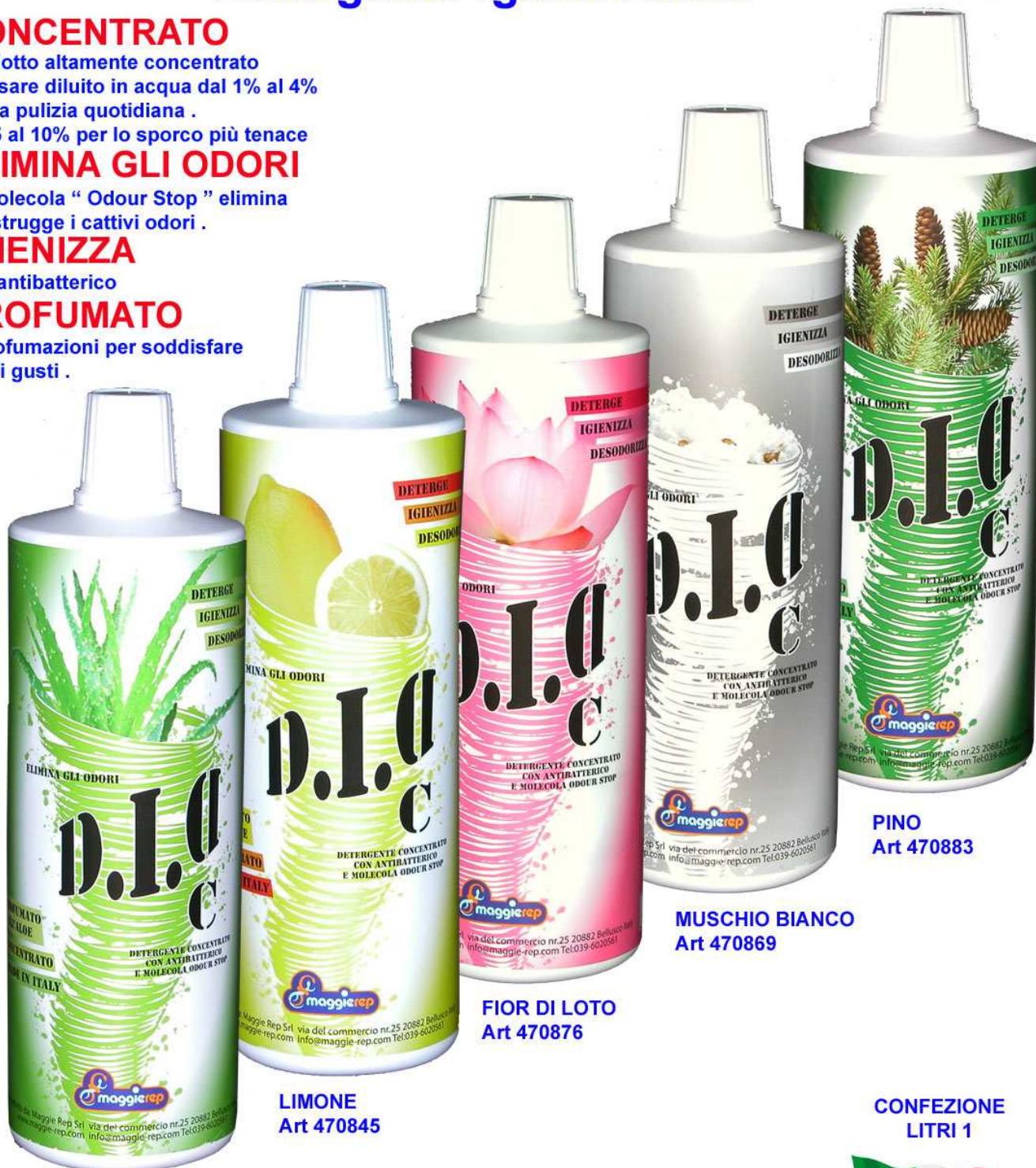
ALOE Art 470852

5 profumazioni per soddisfare tutti i gusti .